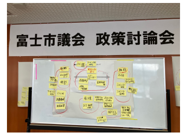
富士市議会 政策討論会

中央病院の新病院建設、富士駅前整備、公共交通の充実が検討されています。これらテーマの先進市へ視察にいきました。豊川市民病院は、カインド(親切)病院を目指しているそうです。雰囲気がとても伝わりました。