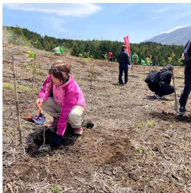
富士山の麓で行われた ブナ林創造事業で植樹