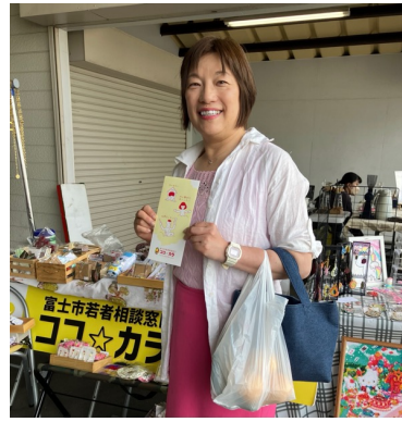
若者支援を行なっているココカラ のブースへ立ち寄り