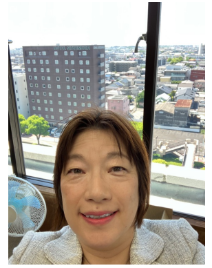
議員控室の引っ越し