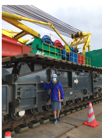
富士市 富士川かりがね橋 視察