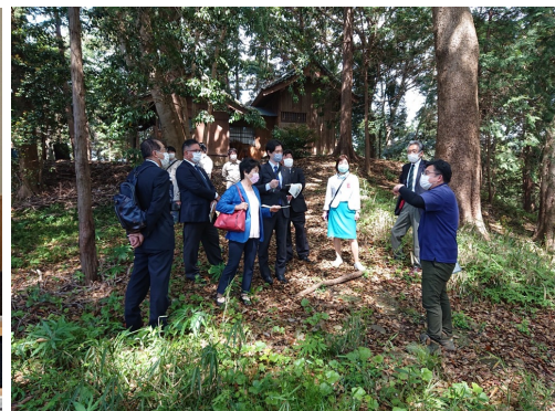
富士市 浅間古墳視察