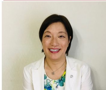
富士市のスマイルバッジ。写真が下のようになります。