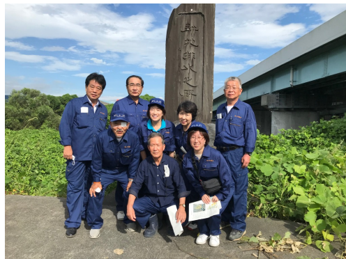
富士市 浸水対策 視察