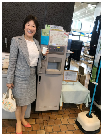
富士市役所 給茶器には市内の緑茶の提供