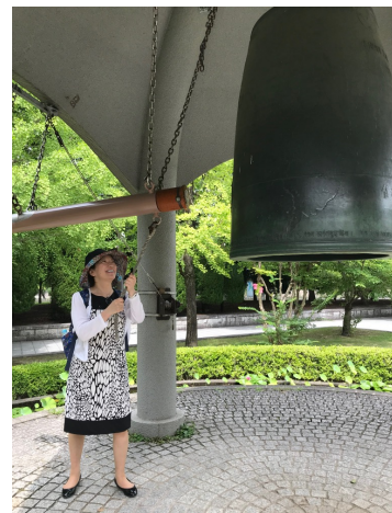
広島市 平和祈念式 参列