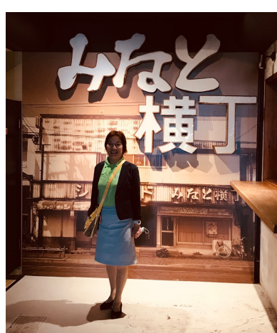
静岡市用宗 港周辺 視察