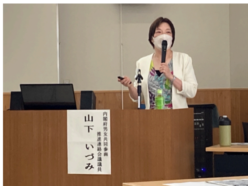
富士市 「女性参画まちづくり」 講演